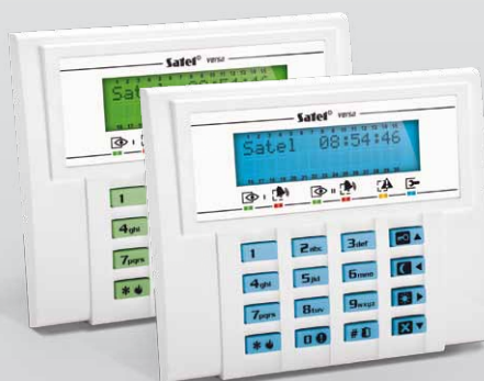
VERSA-LCD-GR / VERSA-LCD-BL