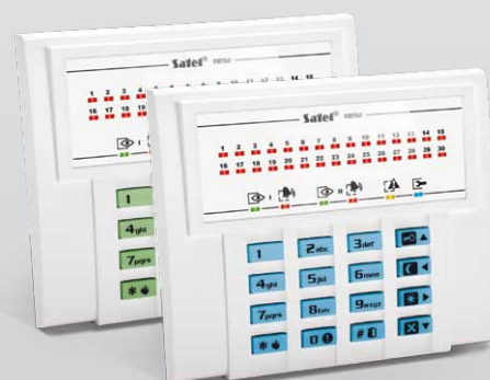
VERSA-LED-GR / VERSA-LED-BL