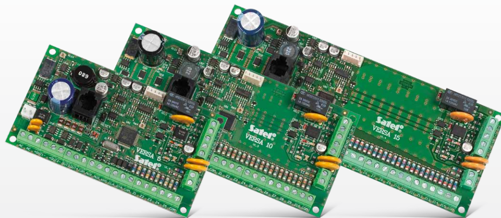
VERSA 5 / VERSA 10 / VERSA 15